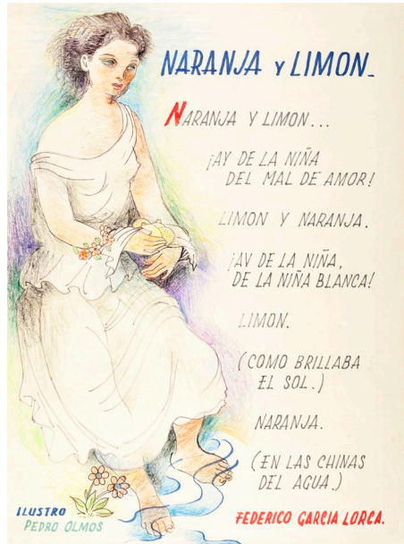
Figura 10. «Naranja y limón», poema de Federico García Lorca ilustrado por Pedro Olmos. Colección Artes Visuales, Museo de Arte y Artesanía de Linares, n° inv. 270-60.

para la zona. En dicha ruralidad maulina difundida por el grupo, el paisaje natural tuvo un rol preponderante, determinando el desarrollo de oficios tradicionales que constituyen una parte medular en la obra de los integrantes de Ancoa. Por el papel protagónico que otorgaron a dicha cultura, y por su afán de resguardarla en el MAAL, es posible asegurar que el Grupo Ancoa se configuró como el colectivo artístico y cultural más relevante del Maule.