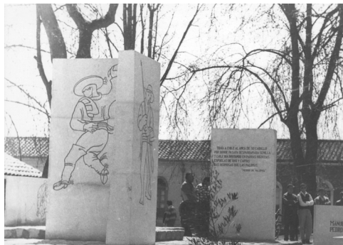
Figura 3. Inauguración del monumento al poeta Manuel Mesa Seco y al pintor Pedro Olmos, obra de Armando Álvarez, en la Alameda Valentín Letelier de Linares, 25 de septiembre de 1992.

en Putagán, cerca de Linares. Fue profesora de Estado en Artes Plásticas de la Universidad de Chile (1968) y se desempeñó como docente en distintos establecimientos del Maule entre 1969 y 1980. Ocupó el cargo de directora del MAAL entre 1987 y 1998, y de 1999 a 2004 se desempeñó como investigadora en la misma institución. Desde la Dirección del museo gestionó alrededor de diez ferias artesanales de carácter internacional, favoreciendo siempre la participación de los miembros de Ancoa. Como artista visual realizó exposiciones colectivas e individuales a lo largo de Chile y en el extranjero, destacando en la Bienal de París de 1971. Obtuvo varios premios, entre ellos el segundo lugar en el Salón del Maule en Constitución (1986) y el Premio Municipal de Arte Municipalidad de Linares (1996).