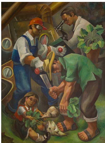
Figura 5. Pedro Olmos. Proceso del azúcar , mediados de la década de 1970. Óleo sobre madera, 213 x 153 cm. Colección Artes Visuales, Museo de Arte y Artesanía de Linares, n° inv. 267-181.

La ruralidad cruzó transversalmente las pinturas, dibujos y poemas del grupo. Si bien algunos de sus artistas expusieron individualmente en circuitos internacionales, fueron las muestras colectivas las de mayor alcance regional. A través de las obras allí exhibidas, Ancoa instaló un imaginario común sobre el significado del Maule como espacio cultural.